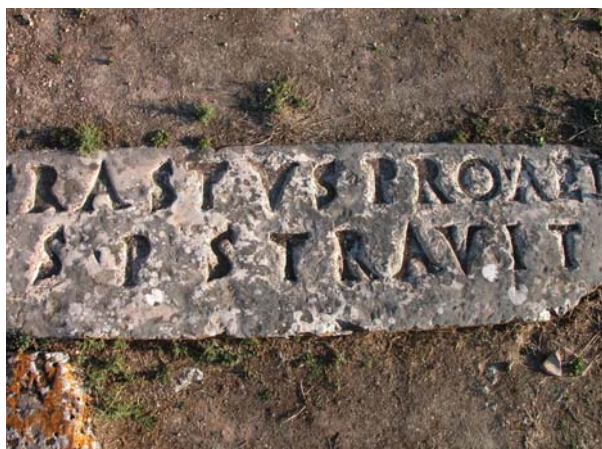
Надпись с упоминанием Эраста на камне мостовой. Коринф