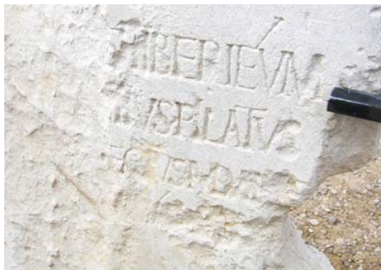
Надпись с упоминанием Понтия Пилата, найденная на камне в кладке мостовой в Кесарии Приморской.